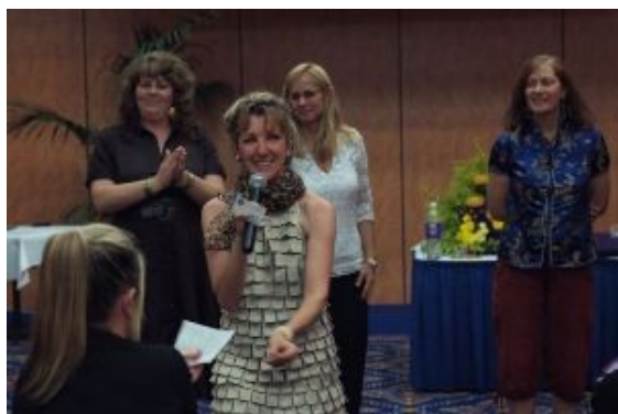
Au plaisir de vous voir et de vous guider!